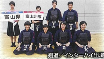
剣道部/インターハイ出場