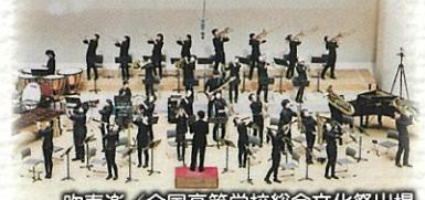
吹奏楽部/全国高等学校総合文化祭出場