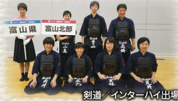
剣道/インターハイ出場