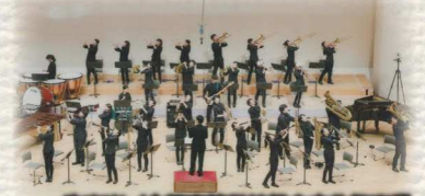
吹奏楽/全国高等学校総合文化祭出場